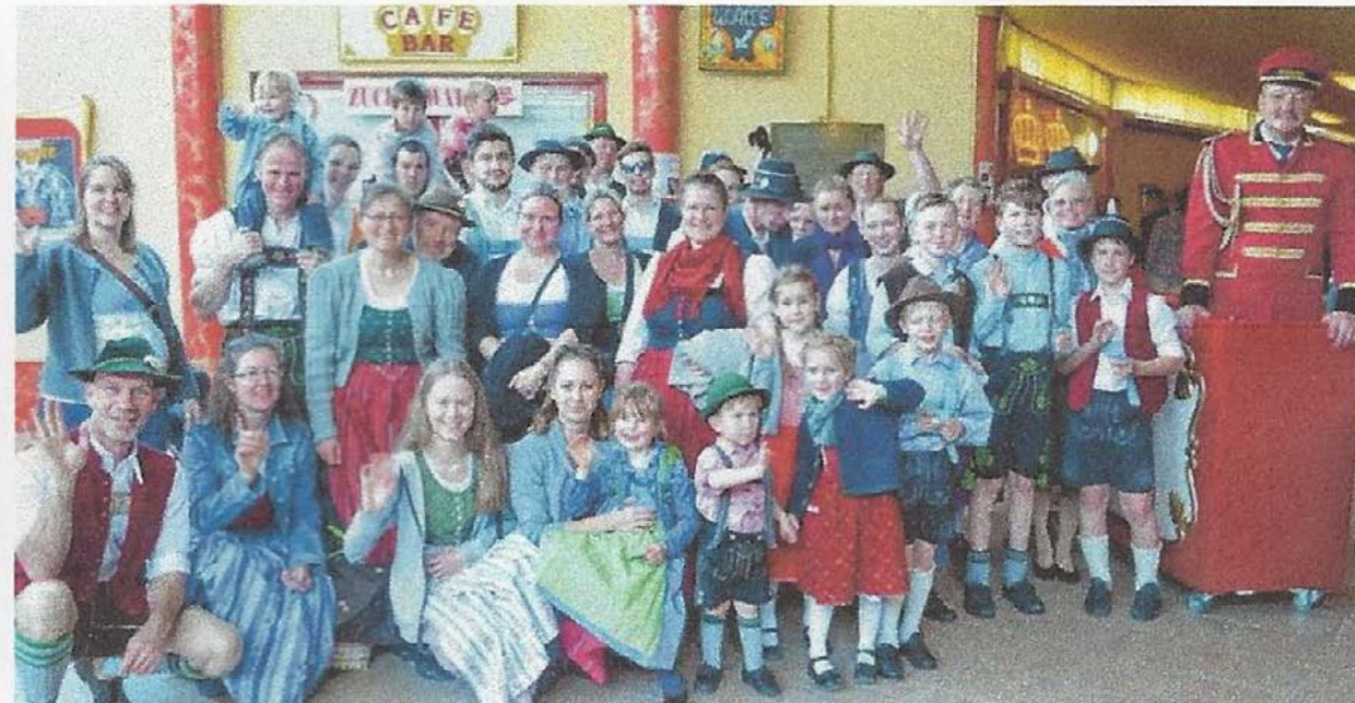
Die Kinder und Jugendlichen vom Heimat- und Trachtenverein d' Ammertaler Dießen-St. Georgen werden den Besuch in Europas größtem Zirkus, dem Krone-Bau an der Marsstraße in München, nicht so schnell vergessen.